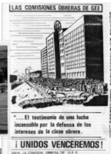
Revista de CCOO de la GEE de 1977