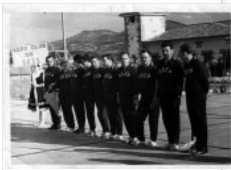
Niños de la guerra acogidos por la URSS.

Sede de CCOO en Bilbao: Uribitarte, 4. Tfno. 94243424. e-mail: j-unanuefundazioa@euskadi.ccoo.es .