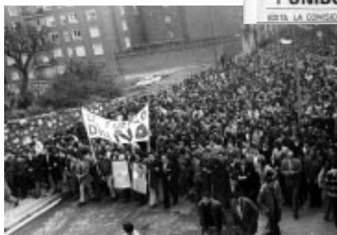
Protesta en Barakaldo contra la contaminación de Sefanitro y la nueva planta contaminante. Años 70.