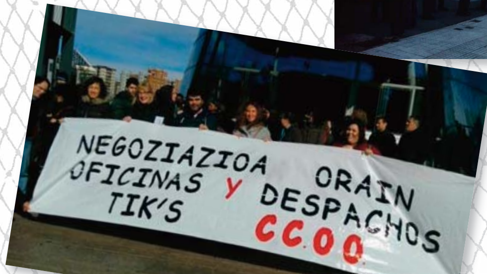
OFICINAS Y DESPACHOS