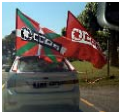
07.00 horas. Salida de piquetes informativos y caravanas desde todas las comarcas de Euskadi.

El éxito de la jornada de huelga del 29 de Junio en Euskadi se reflejó en un seguimiento muy relevante en numerosos sectores y la participación multitudinaria en las manifestaciones