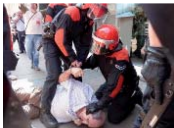
11.00 horas. Altercados con la Ertzaintza en Vitoria-Gasteiz. Carga policial en Bilbao.