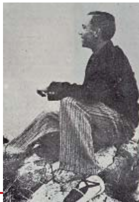
El poeta Miguel Hernández en 1934.