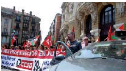
13.00 horas. Unai Sordo: "Esta huelga ha sido importante y responde a un movimiento sostenido de movilización que tiene que desembocar en una gran huelga general el 29 de septiembre en todo el Estado para reconducir una situación de ataque a los derechos de mucha gente".