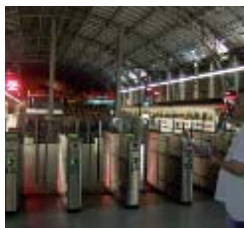
08.00 horas. El transporte urbano en las grandes ciudades permanece paralizado.