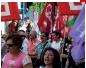
12.00 horas. La convocatoria de CCOO reúne a miles de personas en las manifestaciones de las tres capitales vascas.