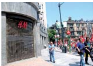
10.00 horas. Comercios de las capitales cerrados.