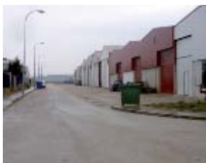
09.00 horas. Gran incidencia en importantes empresas y polígonos industriales.