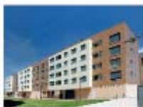
Residencial Las Murallas, Zabalgana VITORIA-GASTEIZ