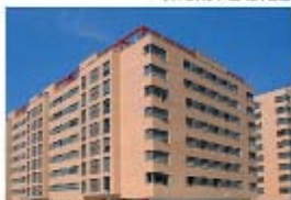
Edificio Praga, Salburua VITORIA-GASTEIZ

Abierto plazo de inscripción para todas las personas empadronadas en cualquier municipio de Euskadi que cumplan los requisitos para ser adjudicatarias de una vivienda VPO