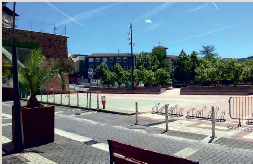
Lugar en el que se celebró la asamblea.