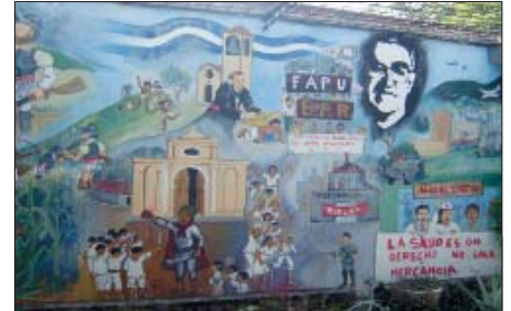
Mural de la sede de la CSTS.

Otra de las cuestiones que más sorprende es el problema de inseguridad y violencia. La delincuencia está organizada en maras (bandas juveniles) que atracan, extorsionan y matan; modo de supervivencia para muchas personas. Pero lo más grave es que el propio Gobierno permite, tolera y en muchos casos potencia este tipo de violencia porque con ello justifica los controles sobre la población, las leyes antiterroristas y la desaparición de personas críticas bajo el amparo de la delincuencia.