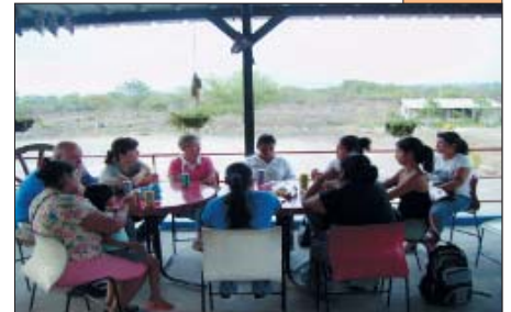
Reunión con las trabajadoras de la Maquila de El Pedregal.