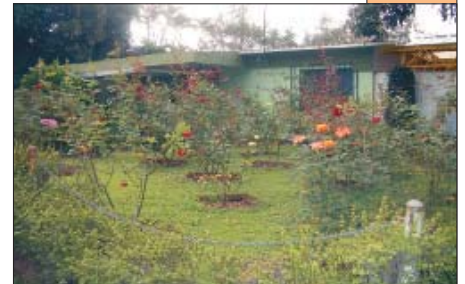
Lugar donde asesinaron a los jesuitas de la UCA en noviembre de 1989.