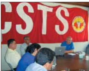
Reunión con la CSTS.

En estos momentos se está constituyendo una Confederación Sindical de Trabajadores Salvadoreños (CSTS) que está tratando de aunar esfuerzos organizativos y de propuesta. Y existe el Frente Sindical de Trabajadores de El Salvador (FSTS) que es un órgano de coordinación de la mayor parte de organizaciones sindicales.