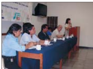
Conversatorio de diferentes organizaciones sindicales de El Salvador.

El país está totalmente vendido a las multinacionales norteamericanas, sólo el 17% de la población tiene trabajo asalariado, el 70% se dedica a la economía informal.