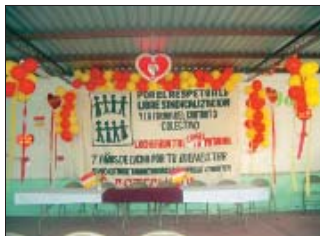
Asamblea del Sindicato Stechar de la Maquila de Charter.

UNEP: Asociación de Trabajadores de los Servicios Públicos y la Administración (educación, sanidad, justicia...etc.).