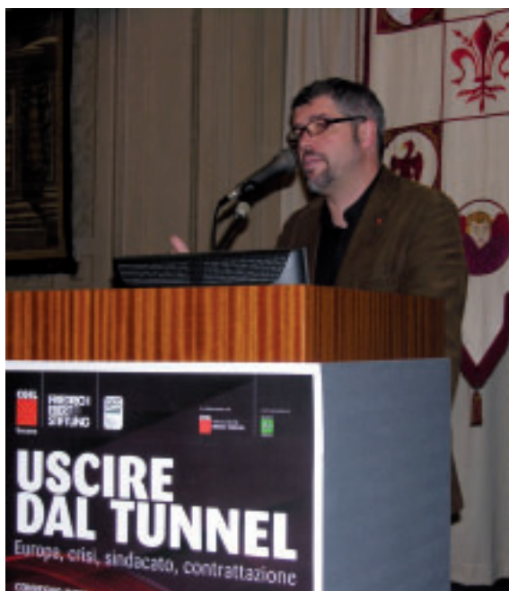
Florença (Italia). Encuentro sindical europeo "Salir del túnel"

Sin duda los efectos y la gestión de la crisis del Gobierno han sido los elementos clave en explicar lo sucedido. La hegemonía que los partidos conservado-