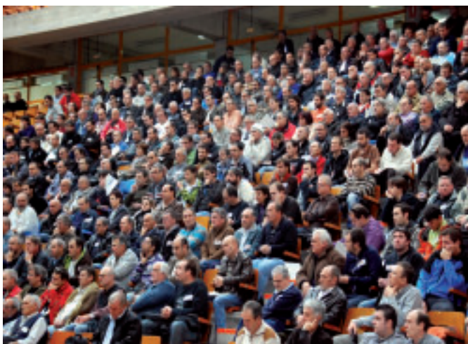
El acto celebrado por la Federación de Industria a principios de noviembre en el frontón Ogueta de Gasteiz fue un éxito, con un millar de participantes y una posterior manifestación que no pasó desapercibida.

Si ELA y LAB no inician el camino para buscar este nuevo espacio de negociación, estarían abandonando a los trabajadores/as vascos/as. Estarían demostrando que la acusación que nos llevan meses lanzando por "llevar la negociación de los convenios a Madrid" -en relación a las negociaciones para convenio estatal del metal- era una farsa.