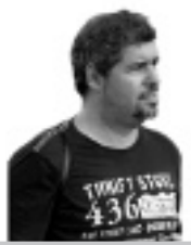
Unai Sordo Secretario General de CC.OO. de Euskadi

Pocas dudas pueden caber ya. Las actuales políticas van a llevar al conjunto de Europa y especialmente a algunos países a una larguísima recesión económica. Esto es más paro, más pobreza, menos derechos, más desigualdad.