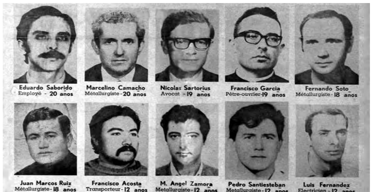
Fotografías de los condenados en un cartel solidario (Bélgica).